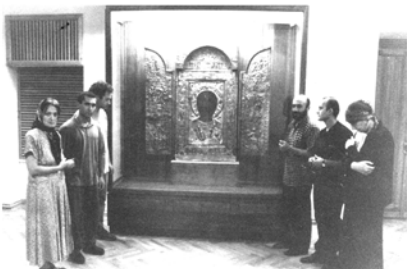
2001 წ. მონღოლეთის არქივისთვის სახელმწიფოებრივი მუშაობა.