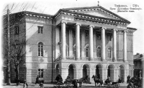
თბილისი - ქვეყნის პრეზიდენტის სასახლე. საინფორმაციო.