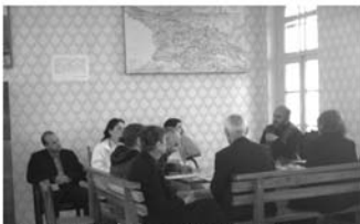
ანონსაციის უზოს შენობა. მრეველი ყურნლის გამოცემის შენობა.