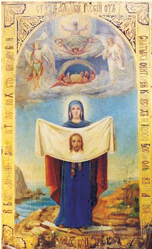
„ზორგ-არტურის“ ღვთისმშობლის სატი. სატის ისტორია ის. ბოლო გვერდზე.