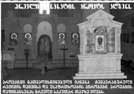
პროექტი გათვალისწინებული იქნება გენერალ-სარდალ რევიანის დასახლება და უსაფრთხოების უზრუნველყოფის მიზნით. პროექტის დასრულებას მრავალი საკითხი თავს დასვა.

„ხლოთ გეგევი თქვენ: უკეთესი არა აღემატება სამართლს თქვენი უფროსის მეგობრობა და ფარისევლთა, ვერ შექედეთ სსუვეველსა ცათასა“ (მათე: 5.20).