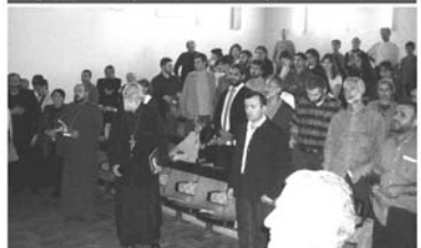
პრეზენტაციის ბოლოს ეველამ ივალბა ანონსაციის ტროზარი და გამოთქვა სურვილი - შტეიტდე დადგენ სიწმიდეების სადრავოზე.