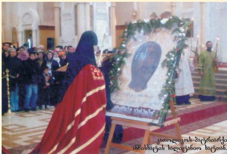
კათოლიკოს-პატრიარქი ანხისხაგის სლიცანო სავთან.

«საუკუნეების მანძილზე ანხისხაგი თავისი მადლით იცავდა და იფარავდა საქართველოს» სრულიად საქართველოს კათოლიკოს-პატრიარქი ილია II